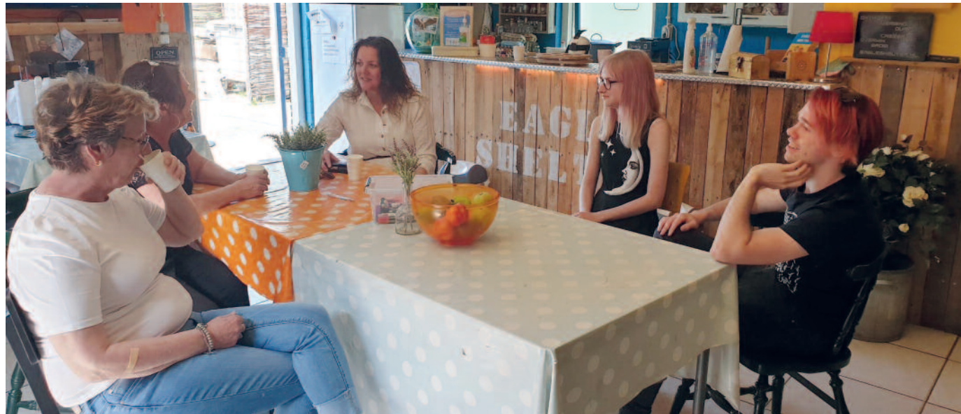
Regievoerder schuldhulpverlening (midden) in gesprek bij Eagle Shelter

Heeft u schulden of financiële zorgen? Is er in uw situatie iets veranderd waardoor u moeite heeft om rond te komen? Bent u bang om in de schulden te raken en wilt u dat voorkomen? Heeft u al te maken met schulden en aanmaningen van schuldeisers? Bij de gemeente Dongen is een regievoerder schuldhulpverlening werkzaam die u advies en tips kan geven. Of in contact kan brengen met instanties die u kunnen helpen.