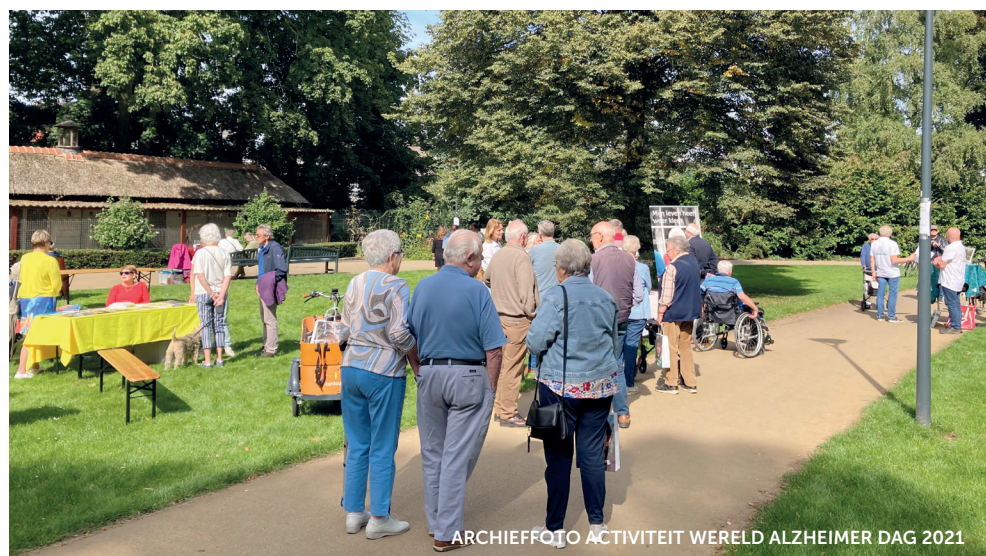
ARCHIEFFOTO ACTIVITEIT WERELD ALZHEIMER DAG 2021

Voldoende beweging is voor iedereen belangrijk. Bewegen zorgt voor plezier en minder stress. En bewegen is heel gezond voor het brein. Voor mensen met dementie kan bewegen helpen om geestelijke achteruitgang te vertragen. Rondom Wereld Alzheimer Dag 2024 hoopt Alzheimer Nederland veel mensen met dementie en hun naasten met plezier in beweging te zien.